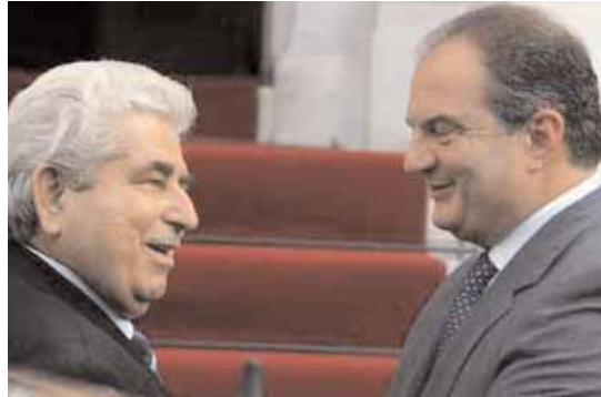
Οι κ.κ. Χριστόφιας και Καραμανλής κατά τη συνάντησή τους στο Μέγαρο Μαξίμου τον περασμένο Νοέμβριο

πρωθυπουργός θα έχει χωριστές συναντήσεις με τους αρχηγούς των κοινοβουλευτικών κομμάτων. Το βράδυ ο πρόεδρος της Κυπριακής Δημοκρατίας θα παραθέσει στο προεδρικό μέγαρο επίσημο δείπνο προς τιμή του πρωθυπουργού και της συζύγου του Νατάσας Καραμανλή.